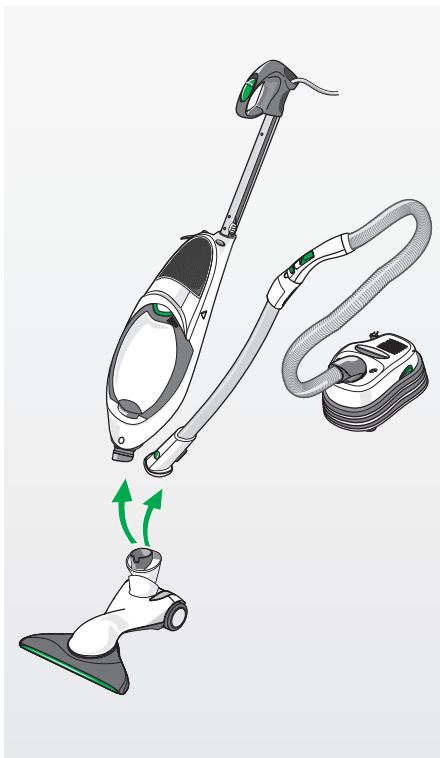
Bild 2 Hartbodendüse, mit Handstaubsauger, Bodenstaubsauger und Elektro-saugrohr

⚠ Vorsicht! Verletzungsgefahr durch innenliegende Bauteile • Drehen Sie den Saugschuh der Hartbodendüse nicht über den Endanschlag hinaus.