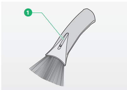
Bild 2 Die Softdüse ausgeschoben