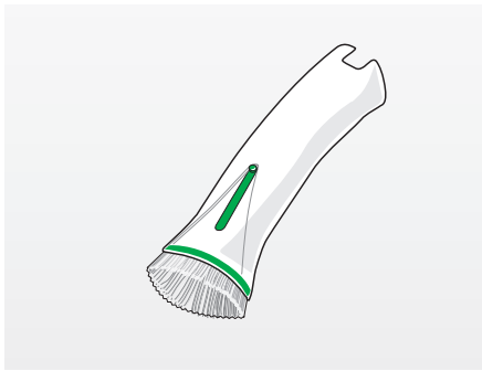
Bild 1 Softdüse eingezogen