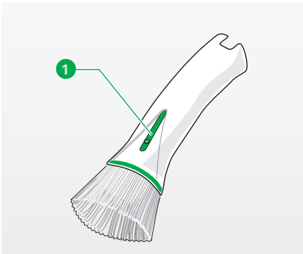
Bild 2 Softdüse ausgeschoben